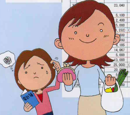
平成18年度 ○○少年団スポーツクラブ決算書